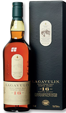
LAGAVULIN ISLAY SINGLE MALT SCOTCH WHISKY 16 YEAR