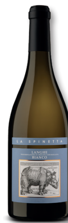
LA SPINETTA PIEMONT LANGHE BIANCO DOC