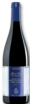
SANTA BARBARA MARKEN ROSSO MARCHE IGT