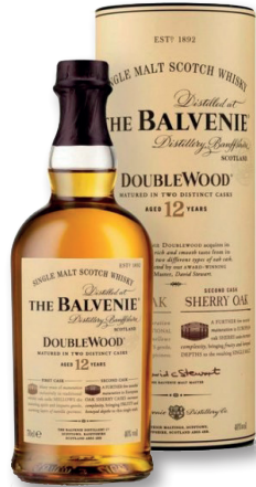
BALVENIE DOUBLE WOOD HIGHLAND SINGLE MALT WHISKEY 12 YEARS