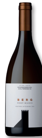
SCHRECKBICHL/ COLTERENZIO – SÜDTIROL BERG DOC