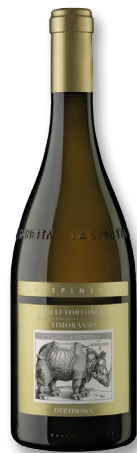
LA SPINETTA PIEMONT TIMORASSO DOC