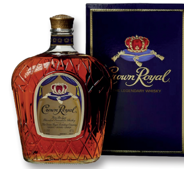
CROWN ROYAL BLENDED CANADIAN WHISKEY