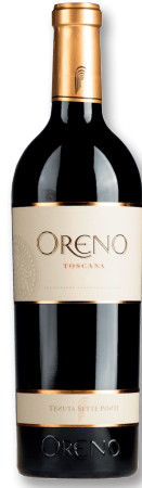
TENUTA SETTE PONTI TOSKANA ORENO IGT

SANGIOVESE CABERNET SAUVIGNON MERLOT | PETIT VERDOT