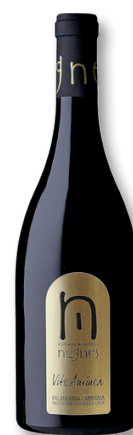
NUGNES KAMPANIEN FALANGHINA IGT FALANGHINA

Die Trauben für den Vite Aminea stammen von den ältesten Weinbergen und sie wurden relativ spät Mitte Oktober geerntet. Das Aroma ist intensiv und hochfein, erinnert an exotische Früchte. Am Gaumen ist er saftig, mit feinsten Mineralik und sehr fruchtig.