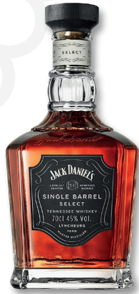
JACK DANIELS SINGLE BARREL SELECT