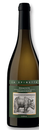
LA SPINETTA PIEMONT LIDIA DOC