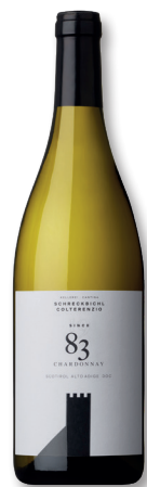
SCHRECKBICHL/ COLTERENZIO – SÜDTIROL SINCE 83 DOC