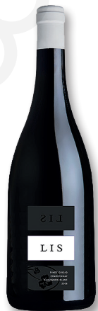
LIS NERIS FRIAUL LIS RISERVA IGT

PINOT GRIGIO | CHARDONNAY | SAUVIGNON BLANC