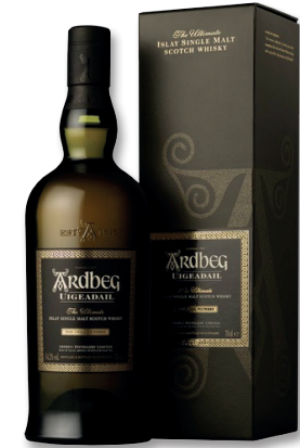
ARBEG UIGEADAIL ISLAY SINGLE MALT WHISKY