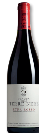
TERRE NERE SIZILIEN ETNA ROSSO DOC