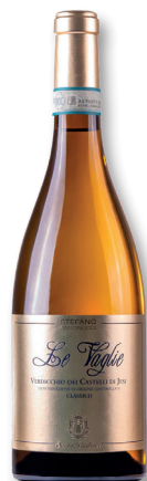
SANTA BARBARA MARKEN VERDICCHIO CASTELLI DI JESI DOC „LE VAGLIE“ VERDICCHIO

Ein Drittel dieses Verdicchios wird für kurze Zeit im Barriue-Fass ausgebaut. Danach reift der Wein für insgesamt 8 Monate im Edelstahltank. In der Nase feine weiße Frucht, gefolgt von Mandelnoten und Ananas. Am Gaumen voll, erfrischende Säure gefolgt von grünem Apfel.