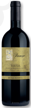
PARUSSO – PIEMONT BAROLO BUSSIA RISERVA ORO DOCG